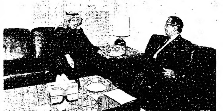
الجميعان لدى استقباله سفير بنغلادش